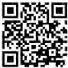
Aplicación de UnitedHealthcare

Ahora está registrado y conectado a la aplicación y al sitio web